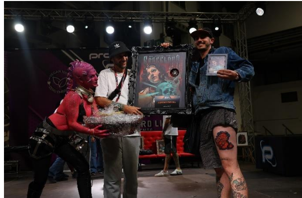
Mejor obra del día (sábado 5)