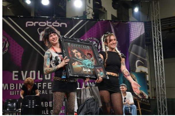
Mejor obra de Realismo