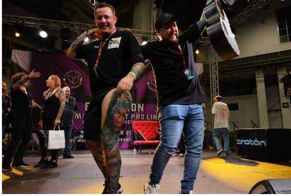
Mejor Obra de la Convención

Para cerrar con broche de oro este resumen, os dejamos con algunas imágenes que muestran a los ganadores de los concurso de Tattoo y sus increíbles creaciones. Estas obras reflejan el altísimo nivel artístico que hemos disfrutado durante todo el festival, y seguro que os inspirarán tanto como a nosotros.