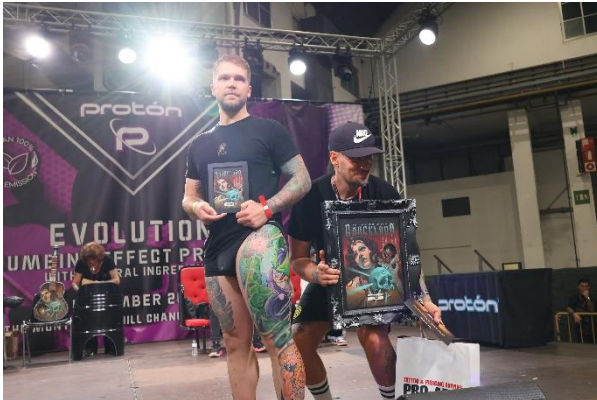
Mejor Obra Anime Color